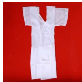
ワンピース型肌着