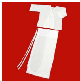
肌襦袢 & 袖よけ